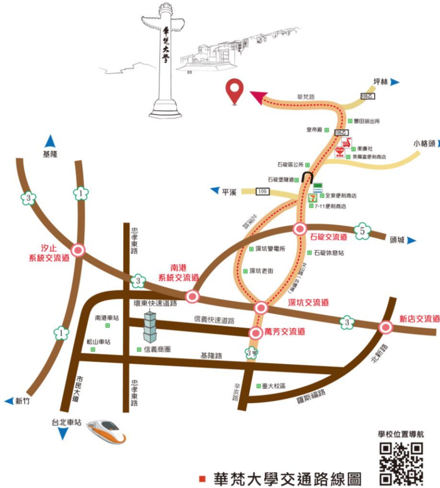
華梵大學交通路線圖